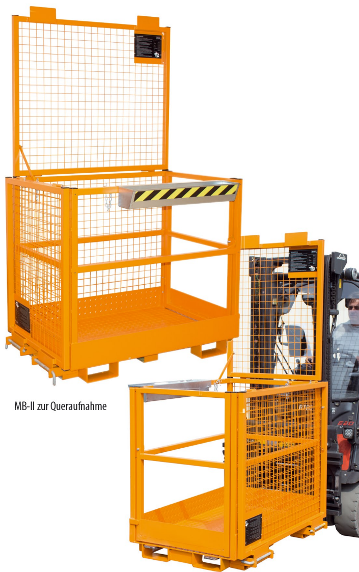
MB-II zur Queraufnahme